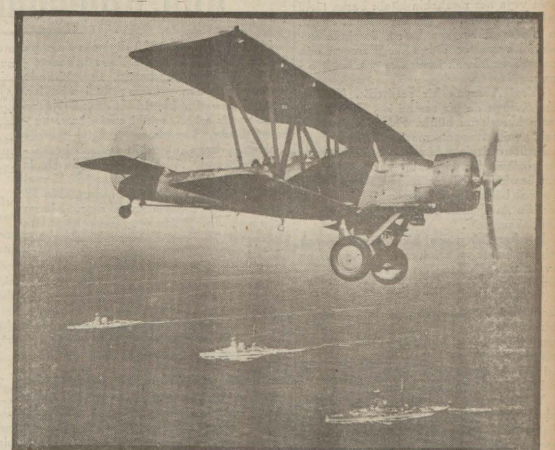
İngilterenin müdafaaında en mühim rolü oynayacak olan iki kuvvet! Donanma ve tayyare

Ankara 15 (Hususî muhabirimizden, telefonla) — Evvelce parafede edilen 21 milyon liralık Alman - Türk ticaret anlaşması yarın (bugün) Hariciye Vekâletinde imzalanacaktır.