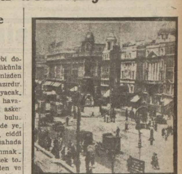
Dublinden bir manzara

İrlanda serbest devleti, Avrupa harbi dolayısıyla vukua gelebilecek hâdiseleri sükunla beklemektedir. Memleket, karadan, denizden veyahud havadan gelecek hücumu hazırdır. Ve bu hücum memleketi gafil avlamıyacaktır. İrlanda serbest devleti, bilhassa havadan gelecek her hücumu ve her türlü asker indirilmesini karşılamaya hazırlanmış bulunuyor. İrlanda serbest devleti dahilinde ye-re inmeğe teşebbüs edecek tayyareler, ciddi güçlüklerle çarpacaktır. Çünkü bu sahada müdafaa tertibatı çok ilerlemiş bulunmaktadır. Muayyen bir haddin daha yüksek tonilâda hiç bir gemi, tevkif edilmeden ve hücumu uğramadan hiç bir limana yaklaşmıyacaktır. Her tarafta sahil bataryaları hazır bulunmaktadır. Ordu, mühim miktarda teknisyenlerin iştirakile takviye edilmiştir. Bu teknisyenler, aynı zamanda mahallî vaziyete de tamamille aşina bulunmaktadır. Pek yakında İrlanda serbest devletinin ken-disini müdafaya tamamille salih büyük bir ordusu olacaktır. Memleketin bitaraflığını muhafazaya ve memleketin müdafasına bü-